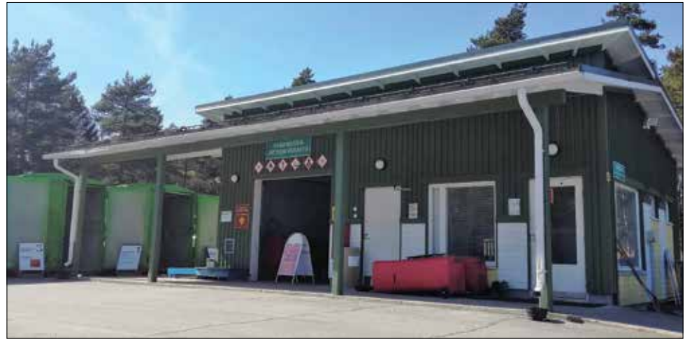
Paimion lajitteluasema palvelee osoitteessa Muurassuontie 4

Paimion lajitteluasemalla vastaanotetaan henkilöautolla, henkilöauton peräkärryllä ja pakettiautolla tuotavia jätekuormia. Suuremmat kuormat vastaanotetaan Topinojan jätekeskuksessa Turussa ja Korvenmäen jätekeskuksessa Salossa.