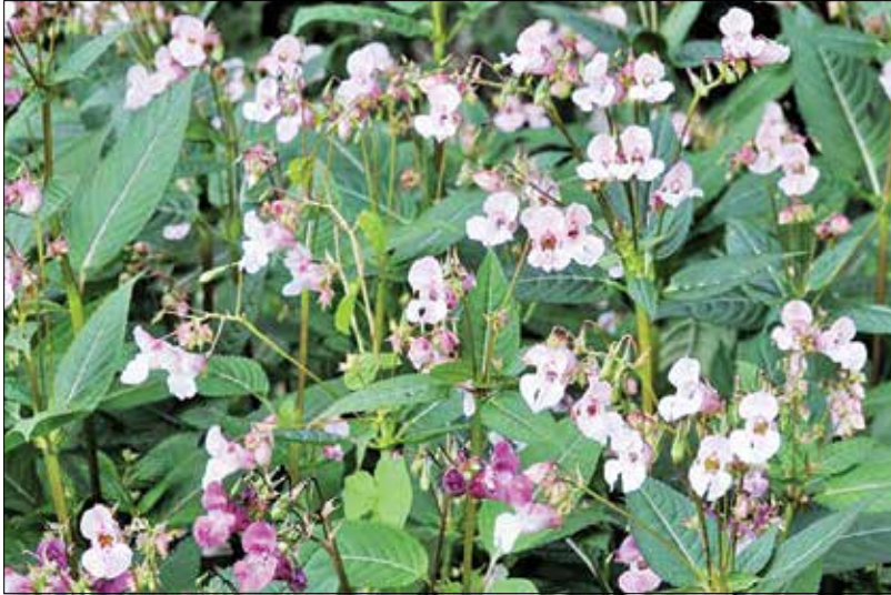
Jättipalsami, kuva: Jouko Rikkinen, CC-BY-NC-4.0

dot. Oinilassa, Ylä-Vistalla, Kriivarissa ja Saaren alueella on tehty espanjansiruetaanasta havaintoja, paikoitellen niitä on jo varsin paljon.