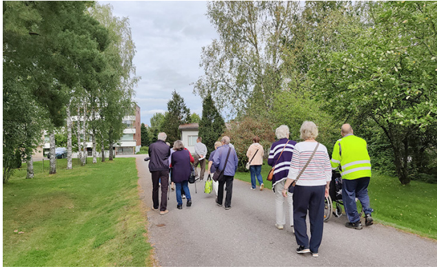
Syksyllä 2023 ryhmä tutustui Pussitien varrella oleviin Paimion ensimmäisiin kerrostaloihin.

Laatuelokuvasarja jatkuu! Kuukausittain BioStarassa (Pussitie 4) näytetään laa-