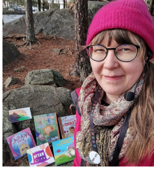
Kirjastonhoitaja ulkosatutunnilla Tapiolassa.