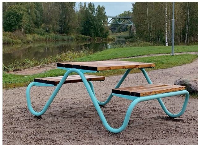
Yksi Jokipuistoon asennetuista piknik-pöydistä

reitit kaltevuutta niin, että täyttää vaaditut esteettömyyskriteerit. Kulkuväylän ja hiekkarannan välille on asennettu puinen reunatuki, joka helpottaa liikunta- ja näkörajoitteisen liikkumista reitillä. Levähdyspaikkoja on lisätty aina sopivan matkan välein sekä reitin kulkua