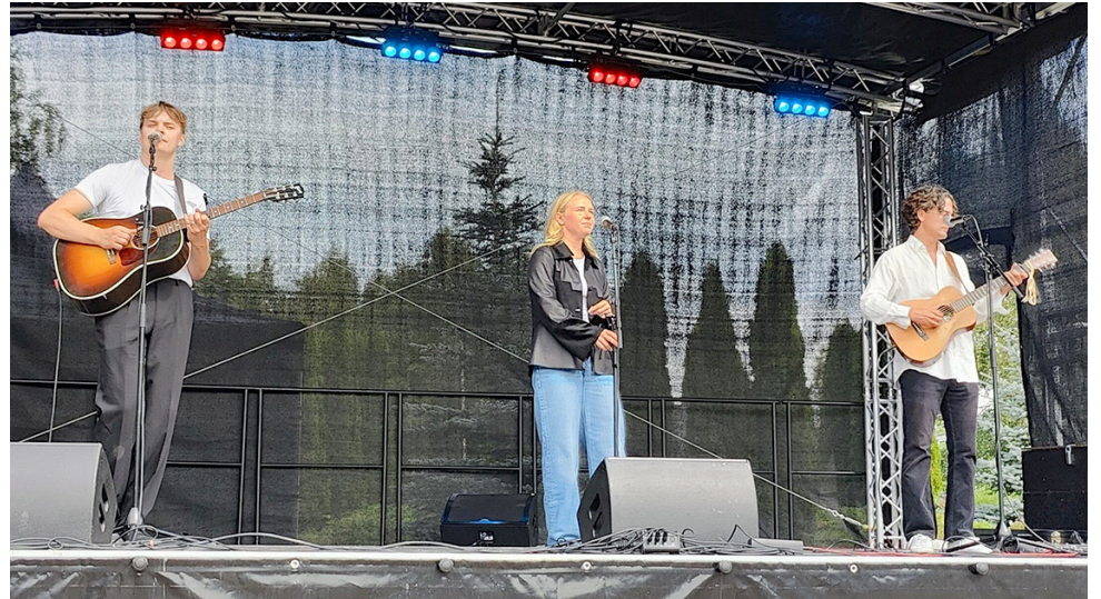
Younghearted-yhtye hankittiin esiintymään elokuisille Harrastusmessuille asukasbudjetin rahoituksella.

Maauimalan ympärille on valmistumassa esteetön noin 600 metrin pituinen reitti. Esteettömyys on huomioitu mm. parantamalla